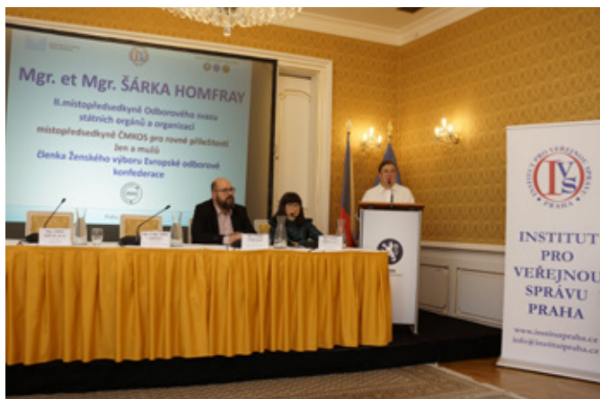
Ve svém příspěvku jsem zmínila i problematiku dehonestace úřednictva.