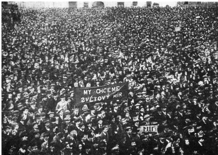
Masová manifestace v Kladně 14. října 1918. Pozornost poutá transparent „My chceme světový mír“.

A než se přesuneme do odborových dějin samostatného Československa, rozloučíme se pro letošek s naším historickým seriálem připomínkou pozapomenuté generální stávky v roce 1918. Události související přímo se vznikem samostatné