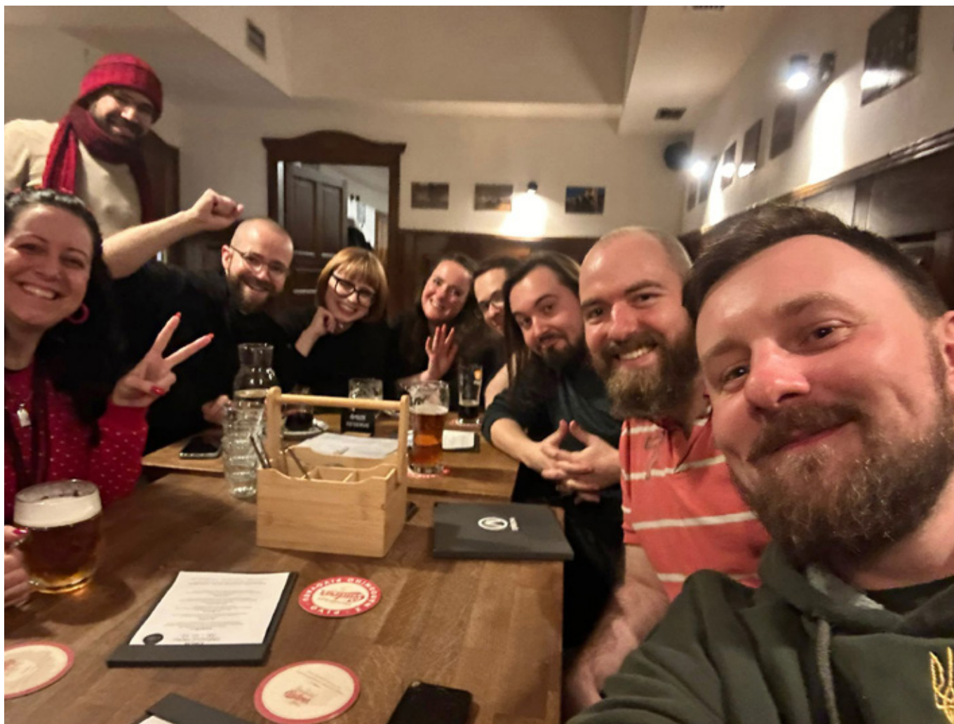
Platforma mladých našeho svazu úspěšně restartovala své aktivity.