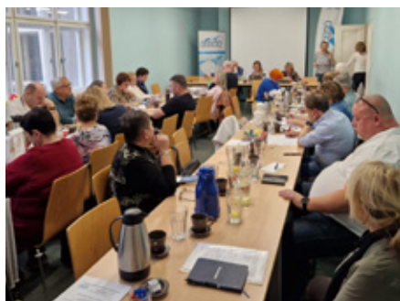
Řízením zasedání byl pověřen předseda a obě místopředsedkyně svazu.

Podstatnou částí programu byly majetkové aktivity OSSOO, zejména aktuální situace ohledně spoluvlastnických podílů na nemovitém majetku v Českých Budějovicích, kde se jedná o odkupu podílu jiného vlastníka. Tato jednání budou pokračovat. Projednaly se i nutné investice