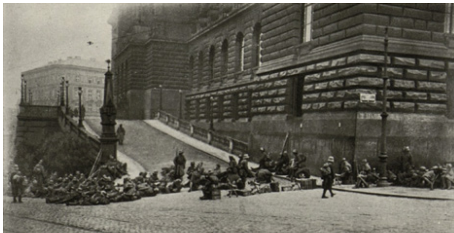
Uherští vojáci během generální stávky obsadili i Národní muzeum.

Pozoruhodná událost se odehrála 14. října v Písku, kde se uskutečnila rozsáhlá manifestace. Živelně rozšířená zpráva o stávce způsobila neorganizované vzednutí děl-