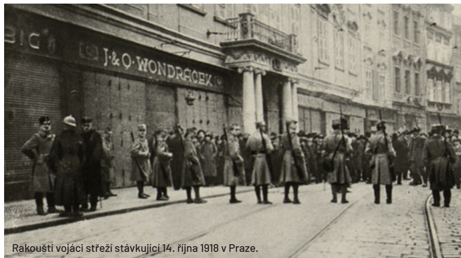
Rakouští vojáci střeží stávkující 14. října 1918 v Praze.