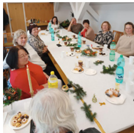
Setkání služebníků proběhlo v příjemné atmosféře.

Jelikož se ministr financí nechal opakovaně slyšet, že do platového systému je potřeba „říznout“, následovala diskuse plná obav, co by takový krok mohl přinést. Naše svazové kolegyně musela mile potěšit mimořádně hojná účast, a to i z řad neodborářů. Všichni přítomní se navíc aktivně zapojovali a diskuse byla skutečně dynamická.