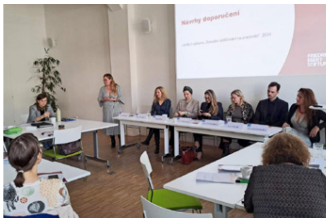
Panelová debata na téma sexuálního obtěžování na pracovišti.