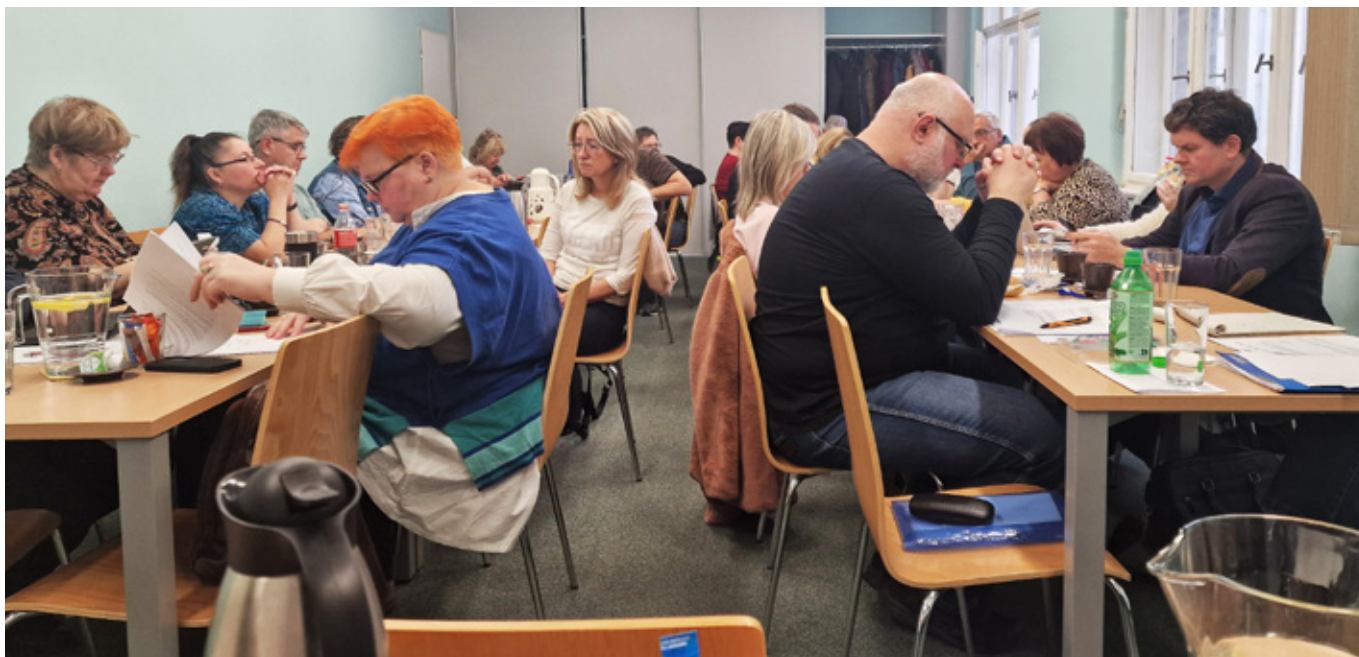
Výbor odborového svazu pravidelně zasedá dvakrát ročně.