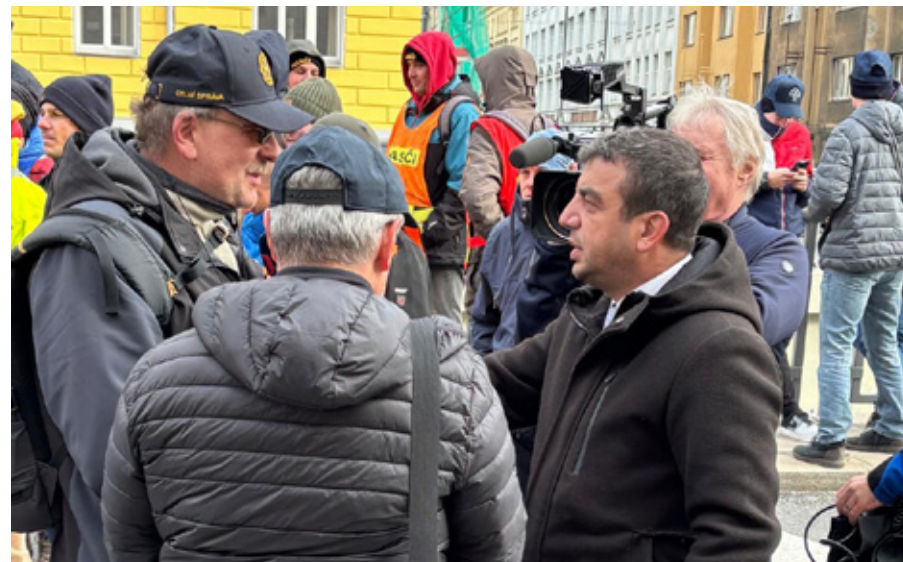
Protestní akce se těšila i zájmu médií.

Bezpečnost státu je prioritou nás všech. A všichni bychom se o ni nyní měli zasazovat.