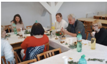
Zástupci odborového svazu rádi přijali pozvání do Ostravy.

Dobrym čerstvým příkladem je i stavební zákon, který se od 90. let změnil tolikrát, že je stále složitější. A jak jsme viděli nedávno, ani jeho digitalizace dosud životy lidem nijak neulehčila, ale naopak natolik zkomplikovala. Každý zkušený úředník či úřednice na stavebním úřadu si může leda povzdychnout, jak to kdysi šlo dobře. Právě tomuto úředníkovi ale pak bohužel dneska občan nadává, i když za digitalizaci stavebního řízení nemůže. Skutečnou zodpovědnost za ni nesou totiž