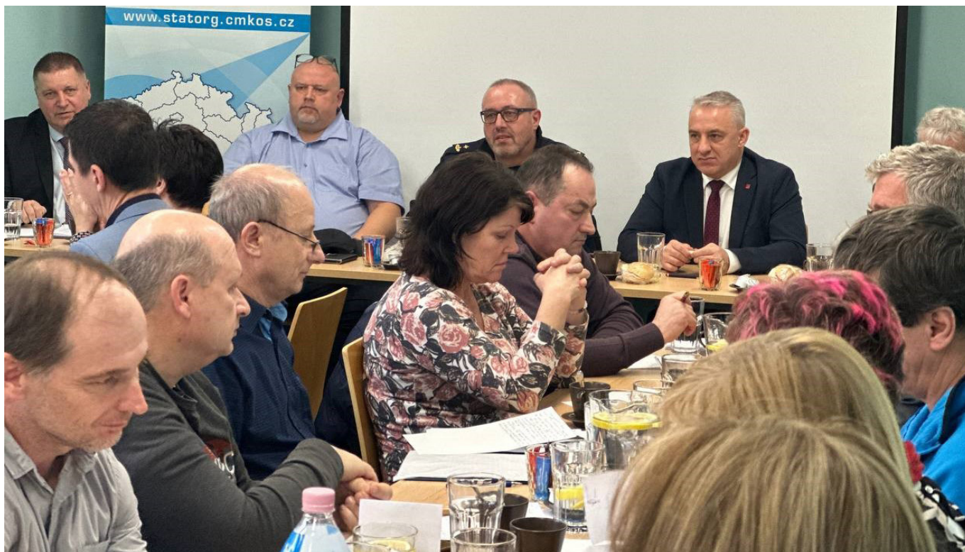
Konference sekce Celní správy se zúčastnili důležití hosté.