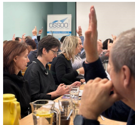
Konference zástupců Celní správy byla volební.