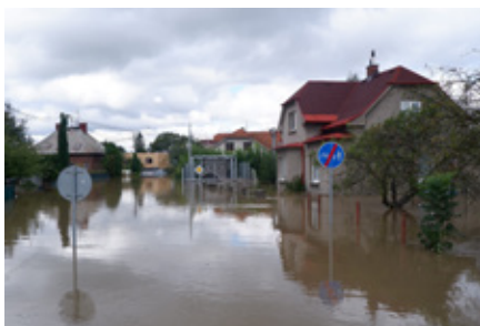
Ostrava Svinov 15. 9. 2024

Do budoucna tedy musíme počítat s ještě ničivějšími meteorologickými jevy. V roce 2021 zemřelo v Německu 188 lidí