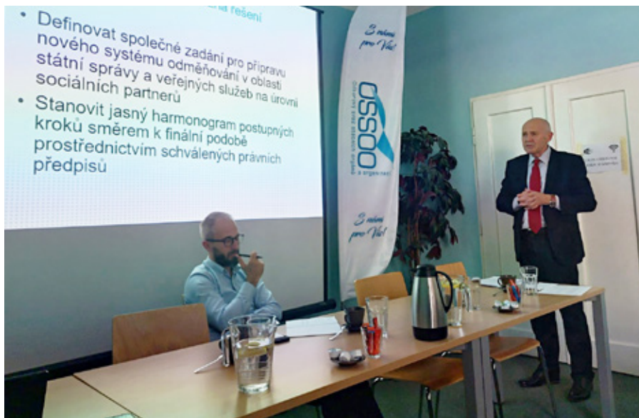
Vážíme si spolupráce a otevřené diskuze.

Webová aplikace poskytuje analýzu a statistiky o počtech zaměstnanců a zaměstnankyň státní správy v České republice. Umožňuje uživatelům porovnávat data o počtu pracujících v různých institucích, ministerstvech a dalších veřejných orgánech. Kromě interaktivních grafů nabízí také časové řady, které ilustrují vývoj počtu zaměstnanců v průběhu let. Nástroj je užitečný pro občany, novináře a odborníky, kteří se zajímají o efektivitu a strukturu státní správy.