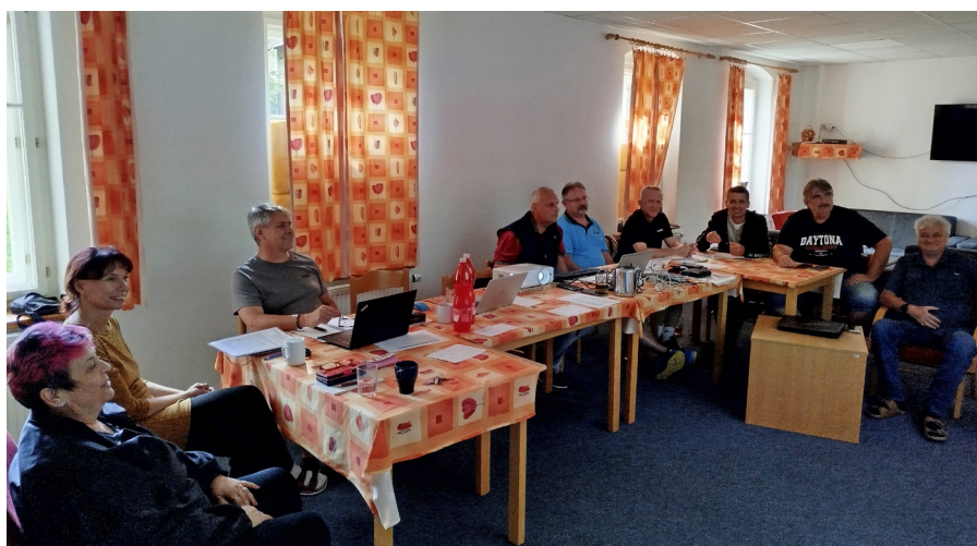
Sekce měla o čem diskutovat.

nastavit nová pravidla pro čerpání finančních prostředků. V zásadě jsou dvě možnosti: první je jejich využití dle aktuálního modelu pro celý rok 2025 se stávajícími řediteli CÚ, druhou pak zplnomocnění ředitelů a ředitelky nových úřadů k uzavření Zásad FKSP již na počátku roku 2025.