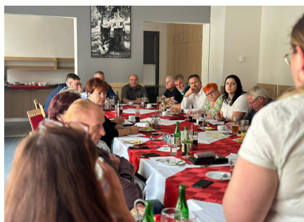
Sekce zaměstnanců policie řeší řadu důležitých témat.

Jednání následně rekapitulovalo neblahou situaci, která v oblasti příslušníků a příslušnic a obecně lidí zaměstnaných u Policie ČR panuje. Nejzásadnějším problémem zůstávají platy. Nejčastější hrubý plat u Policie se pohybuje kolem 24 600 Kč hrubého. Republikový průměr je