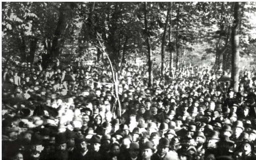
Zlatou éru českého hnutí pracujících zahájily masové oslavy 1. máje 1890 na Střeleckém ostrově v Praze. Bylo jasné, že z dělnictva se stává politicky uvědomělá a sjednocená vrstva občanů usilujících o prosazení svých zájmů.

Marx se v Kapitálu nesnažil o ideologickou likvidaci kapitalismu, jak se lidé mnohdy domnívají. Provedl ale do té doby nejrozsáhlejší analýzu většiny ekonomických jevů, které s kapitalistickým způsobem výroby souvisejí. Nezaklánil se v něm idealistickým étosem a burácivými výzvami k dosažení lepších zítřků, ale poskytl kritický pohled na celou ekonomickou základnu tehdejšího světa. Ukázal tak, že liberální kapitalismus sice vede ke skokovému vývoji produktivity práce, technologickým inovacím a ekonomickému růstu států, ale současně upozornil na to, že průvodním jevem těchto pozitiv je degradace člověka na součástku výrobního stroje, v němž dělník ztrácí své lidské vlastnosti, kvality a schopnosti, zatímco nabývá de facto vlastností nemyslicího stroje.