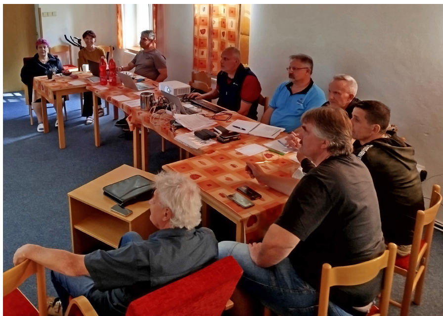
Jednání sekce Celní správy se zúčastnil i předseda svazu.

Při zasedání se pochopitelně dostalo i na oblast FKSP. Rozdělením úřadů v polovině příštího roku nastane poměrně nestandardní situace, a je třeba předem