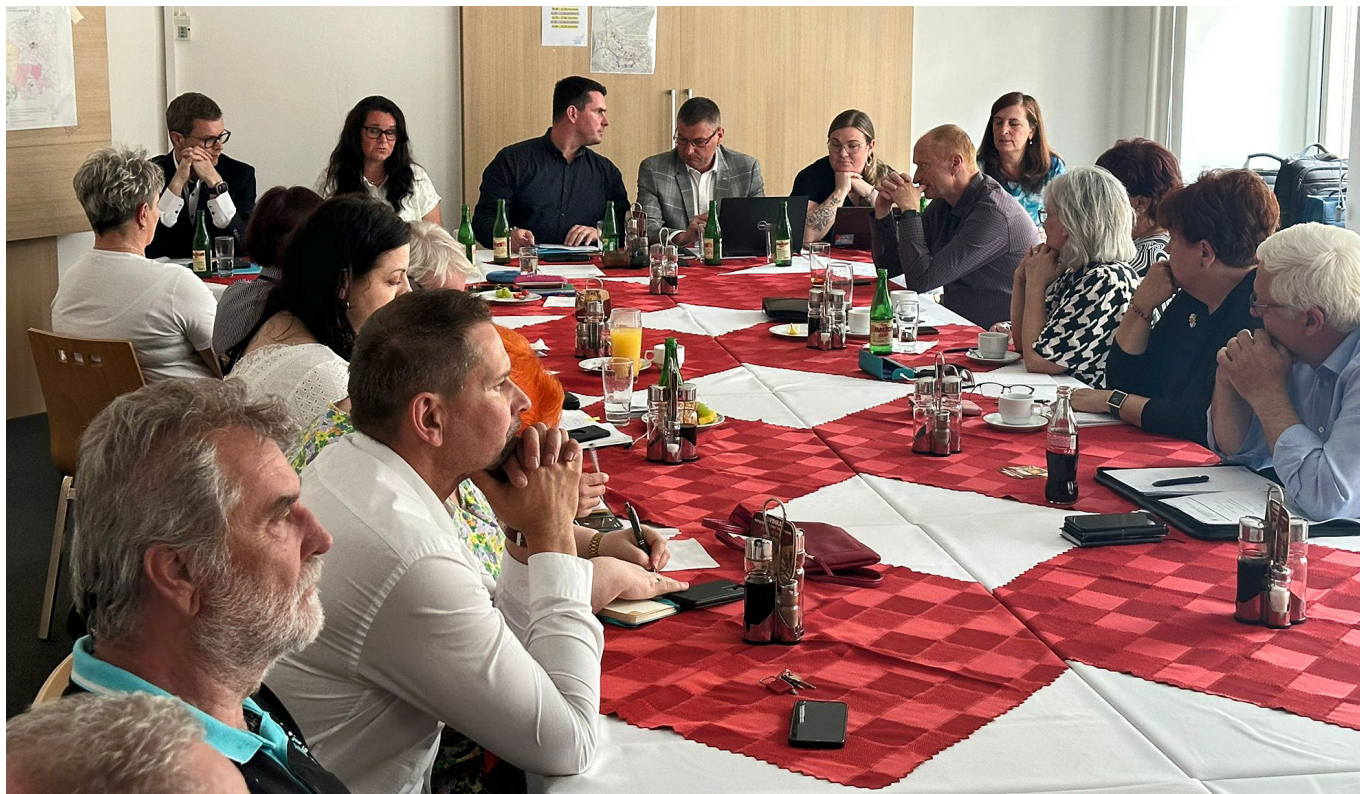
Zasedání sekce se zúčastnila řada milých hostů z Policie ČR, svazu i ČMKOS.